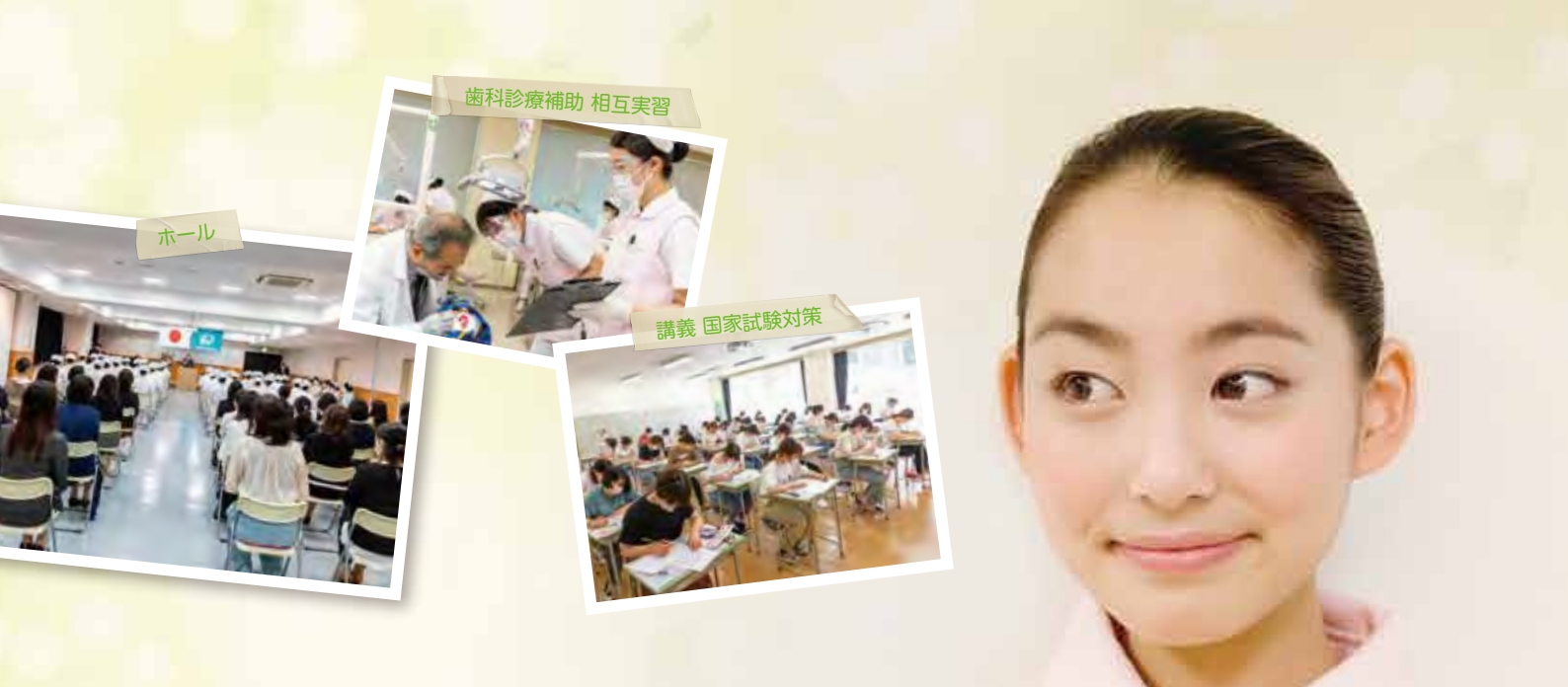
歯科診療補助 相互実習